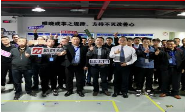
精益质量管理实训营（第一期）