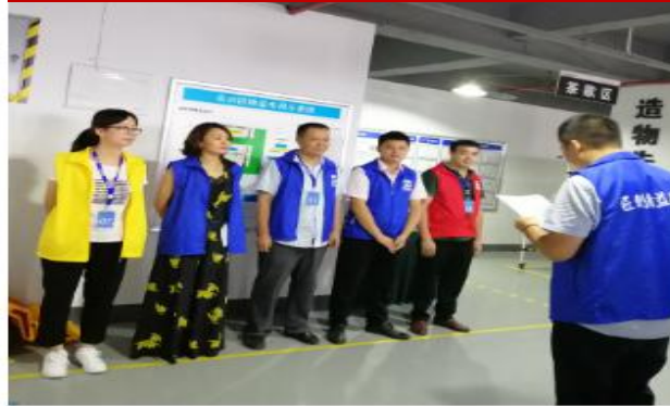
6S 管理推进导师训练营（第七期）