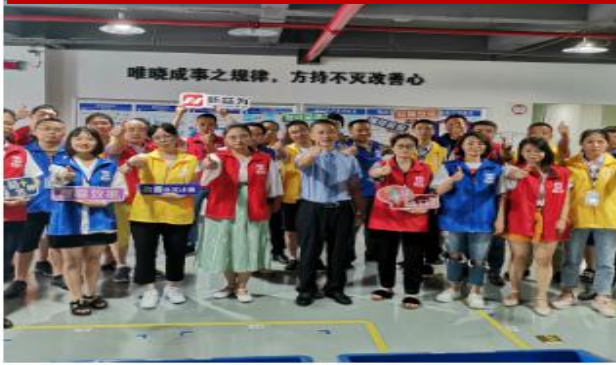
现场管理从理念到实践（第六期）