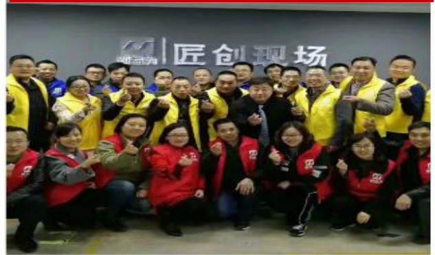
低成本自动化精益道场实训营（第三期）