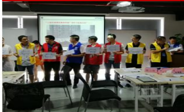
精益生产 JIT 工厂沙盘模拟训练（第二期）