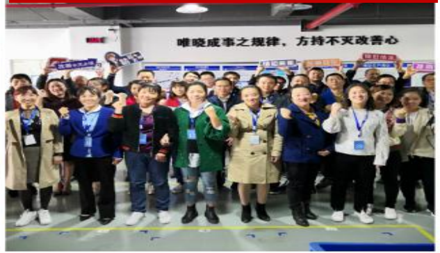
6S 管理推进导师训练营（第五期）